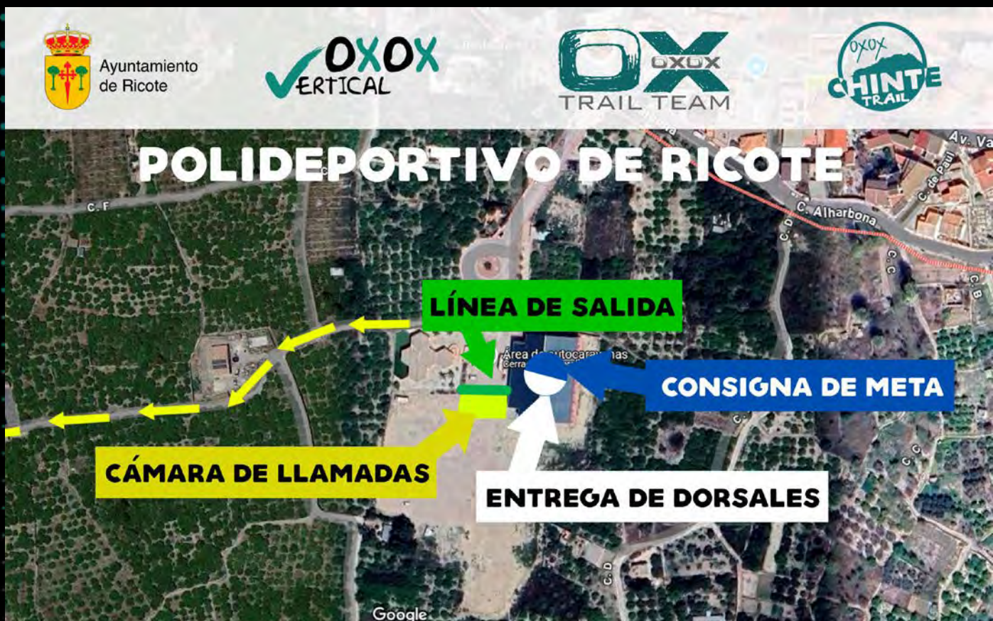
GRÁFICO ORGANIZACIÓN DE SALIDA CAMPEONATO REGIONAL ABSOLUTO Y OPEN NACIONAL (OXOX VERTICAL)